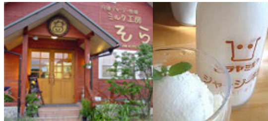
オフィシャルサイト